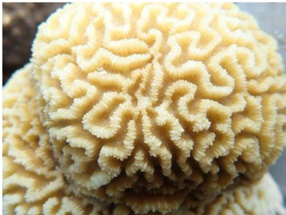
和名：ノウサンゴ 学名： Platygyra lamellina 英名： Lesser valley coral