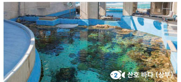
2 산호 바다 (상부)