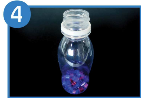
細かく切ったストローをボトルに入れる