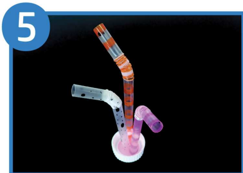
②で作ったアナゴを容器のフタに付ける