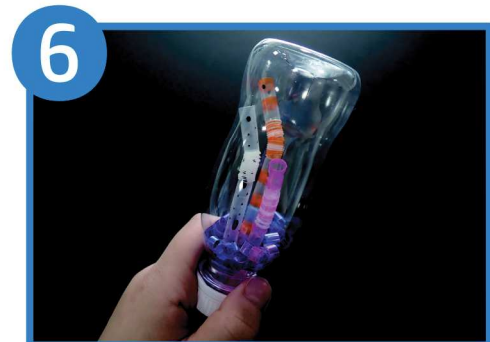
フタをしめて完成