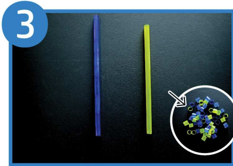
余りのストローに色をぬり、細かく切る