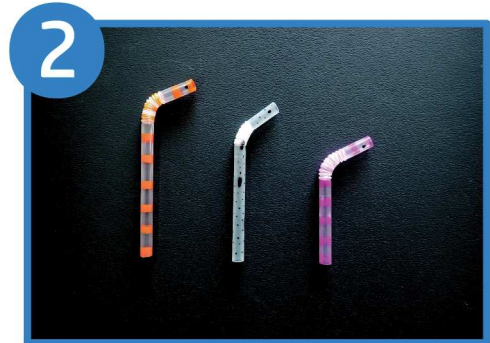
ストローに模様や顔を描く